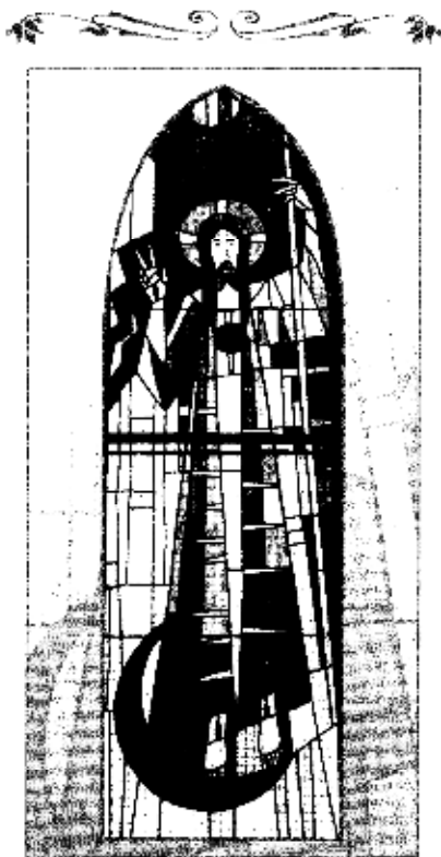
Vítání v koenone st. řky v Hamburku

Já jsem vzkříšen a žít. Kdo věří ve mne, i kdyby umřel, bude žít a neumře navěky (Jan 11,25)